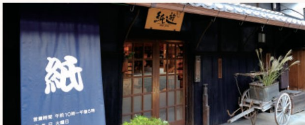
■1999年 直営の小売店（紙遊）開店