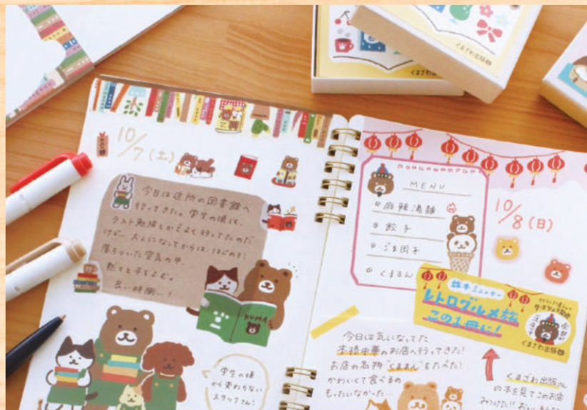
制作事例：オリジナルシリーズ 株式会社パペーリア・イクダ(くまざわ書店)様

弊社商品の 95%は社内デザイナーが作成しており、自社商品だけでなく、多数のお客様の特注品をヒットさせてきました。そのノウハウを生かしながら、人と人をつなげる温かみのあるデザインでご提案をいたします。